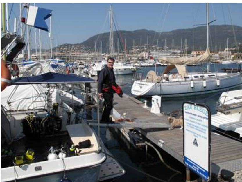
Nous avec nos blocs