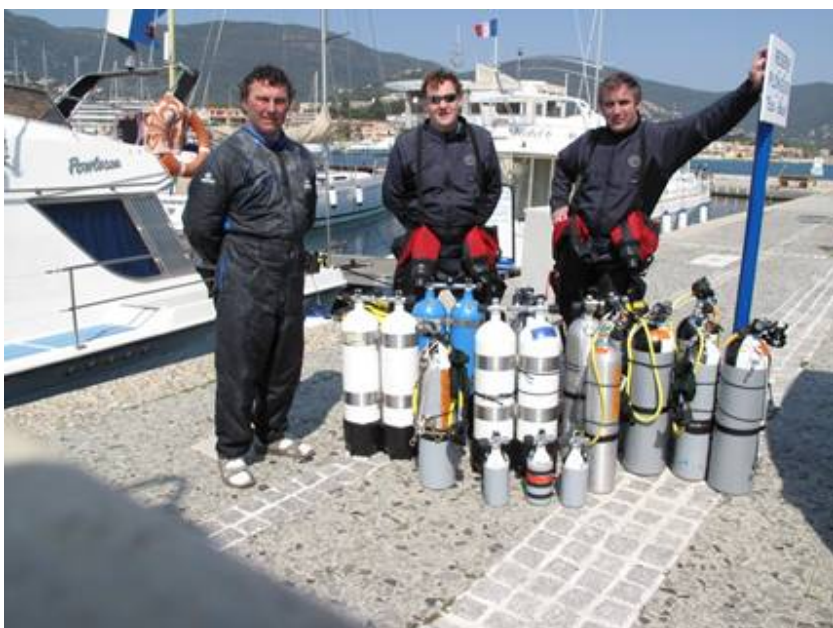
Tout ça pour 3 :