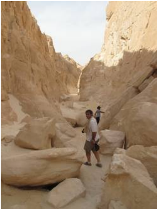
Ca s'élargi par endroits